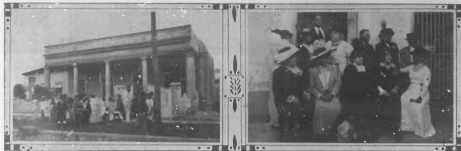
Gasa donde se ha inaugurado la "Creche" del Vedado.—Distinguido grupo de damas y caballeros organizadores de la "Creche" del Vedado

La portada. —El dibujante no ha querido expresar un símbolo piadoso, ni el regocijo inconsciente del niño vivaracho que alegre y alborotador se encanta con las fruslerías de su engañifa y aturde con el estrépito de sus bocinas y tambores congregando á las ilusiones placenteras del misterio del tiempo; no ha querido el dibujante tampoco expresar la nota alegre de los pequeños, ya obsequiados por