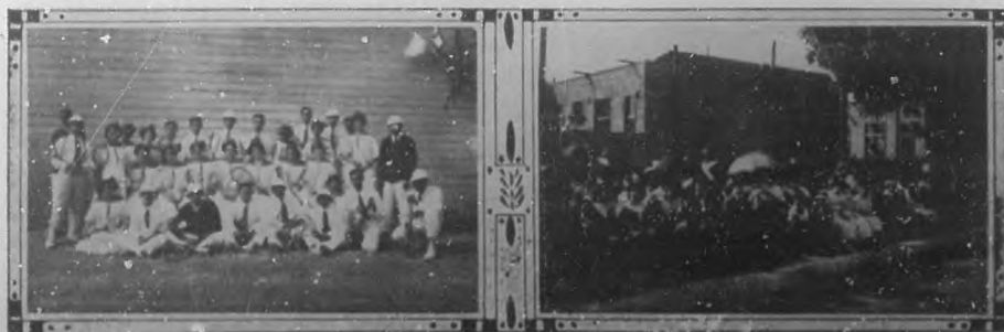
Inauguración, en Jesús del Monte, del "Cuba Tennis Club". Grupo de jugadoras que tomaron parte en el festival. Asistentes al acto solemne de la inauguración.

ginas llenas de emoción, es tenido con justicia entre los primeros, en Cuba, de los escritores que ponen en lo que producen vibraciones y candencias de vida militante o soñadora. Su última producción "La Novela de la vida" ha puesto de relieve esta verdad, y un rendimiento cariñoso de admiración a su autor ha sido el banquete ofrecido al poeta de las gemas arábescas.