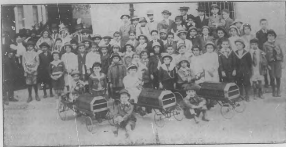
Las carreras internacionales de automóviles de niños. —Interesante fotografía que representa a todos los niños inscriptos que han tomado parte en las carreras de "Bohemia", obtenida en uno de los patios de la Beneficencia.