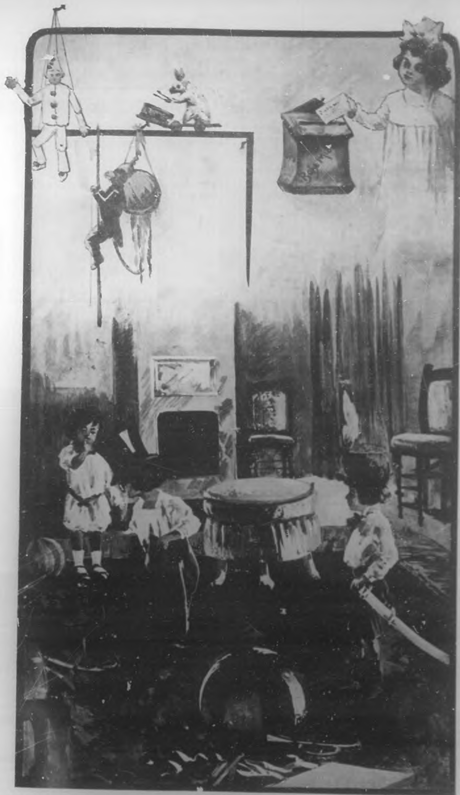
Dibujo de Zepeta.