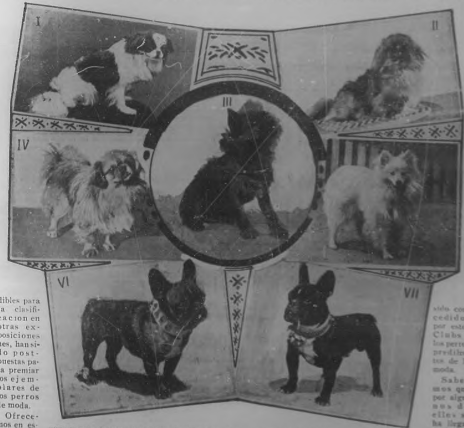
EXPOSICION CANINA EN LONDRES.-1. Cuatro ejemplares preciosos que han sido expuestos en el certamen de perros celebrado en el Palacio de Cristal de Londres.-2. Tres magníficos ejemplares caninos que han llamado extraordinariamente la atención en el certamen celebrado en el Palacio de Cristal.-3. Un canino que ha figurado en la Exposición de perros en el Palacio de Cristal de Londres.

dibles para la clasificación en otras exposiciones, han sido postpuestas para premiar los ejemplares de los perros de moda.