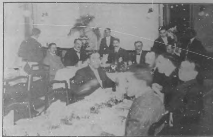
Vista del banquete en honor de Lozano Casado efectuado en el hotel "Telégrafo".

El simpático acto asistió un gran número de invitados, estando amenizado por la Banda de la Beneficencia.